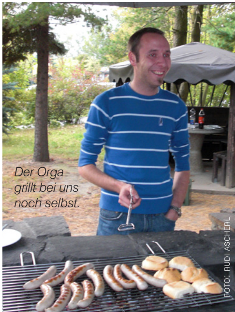
Der Orga grillt bei uns noch selbst.