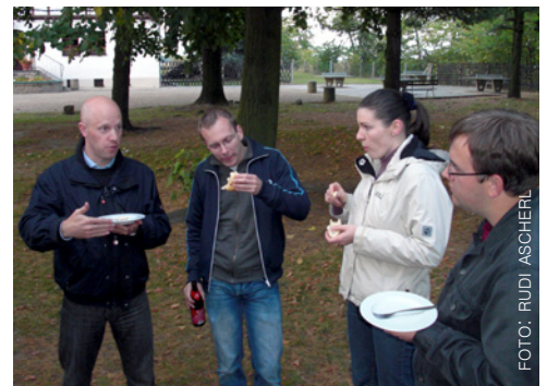
Es gab viel zu diskutieren.